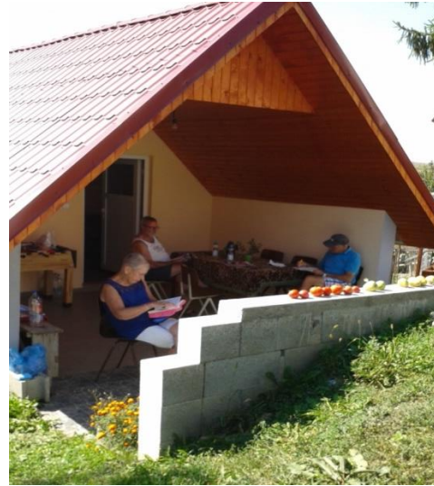
Inkijkje in ons huisje en ons terras.