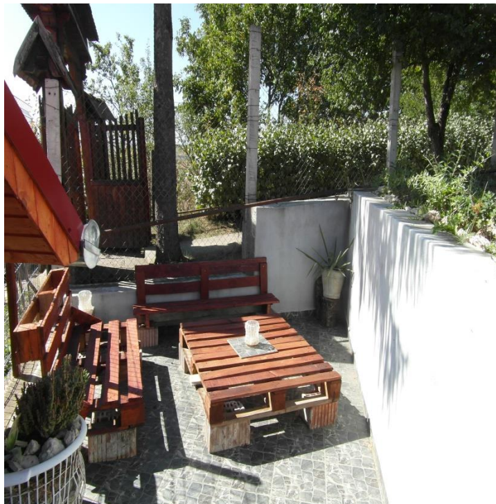
Een hoekje van ons terras.